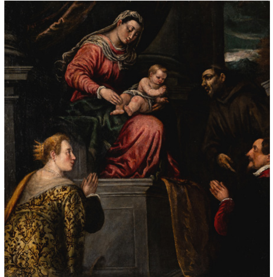
19 Scuola veneta del secolo XVII, bottega dei Bassano Sacra conversazione